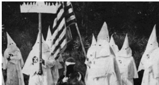
Слика горе: Састанак клана 1922.године

У јесен 1922.год. скован је план за склањање Simmonsа са трона, тада је нови „Imperial Wizard“ постао Hiram Wesley Evans. А 1928.год. ти исти конспиратори видјели су шансу да успоставе контролу над имовином клана која је била процјењена на милионе долара. Настала је борба између Evansа и Simmonsа. Сукоб је окончан у фебруару 1924.год. када је Simmons пристао на поравнање путем исплате.