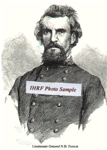
Слика изнад: Ген. конфедерације Nathan B. Forrest . Први и једини Grand Wizard изворног ККК.